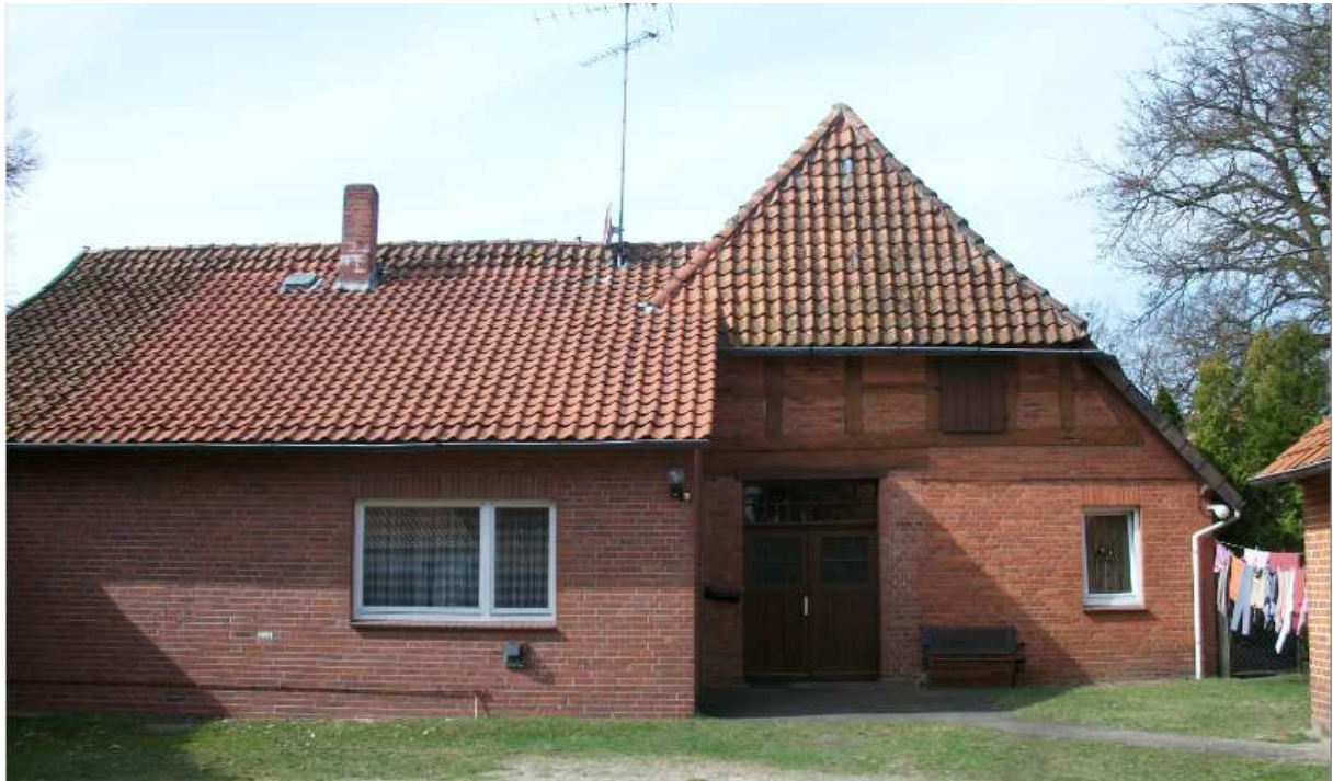
Die Stelle Helstorf Nr. 33