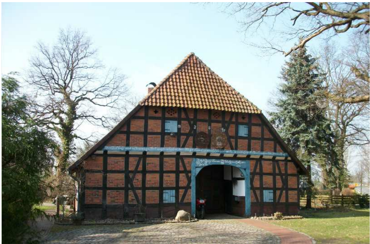
Hof Helstorf Nr. 10 in 2012