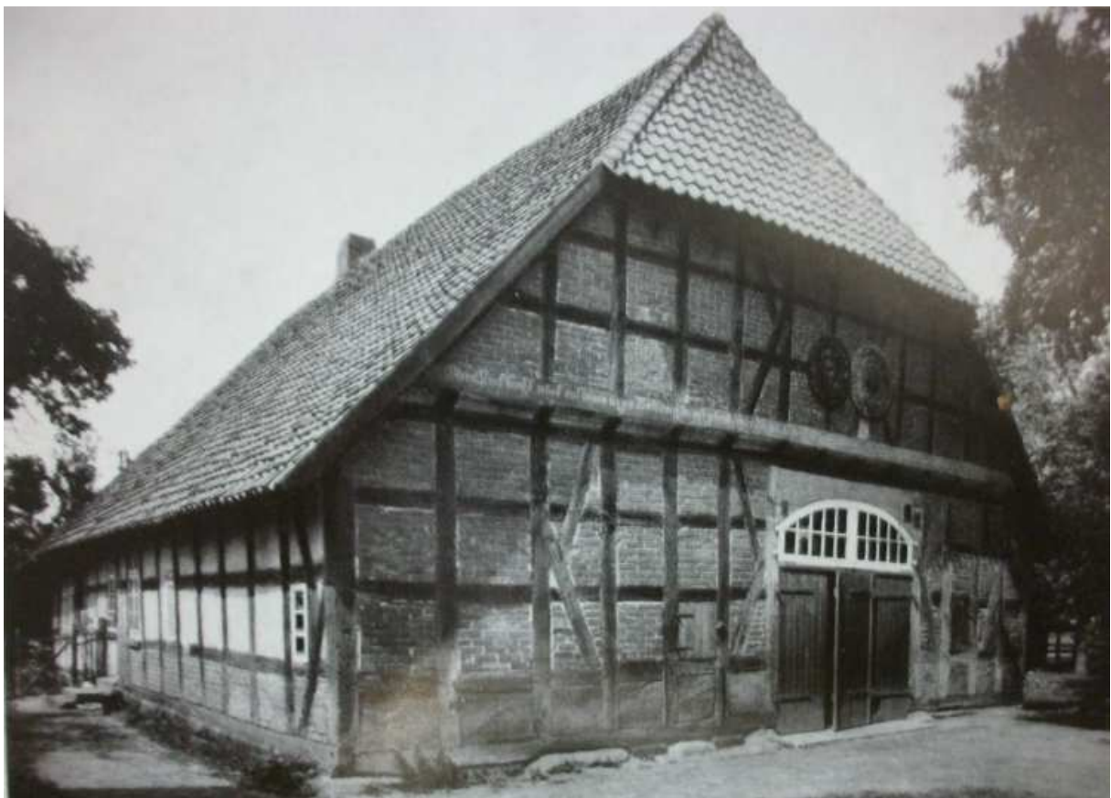
Helstorf Nr. 10 im Jahre 1957