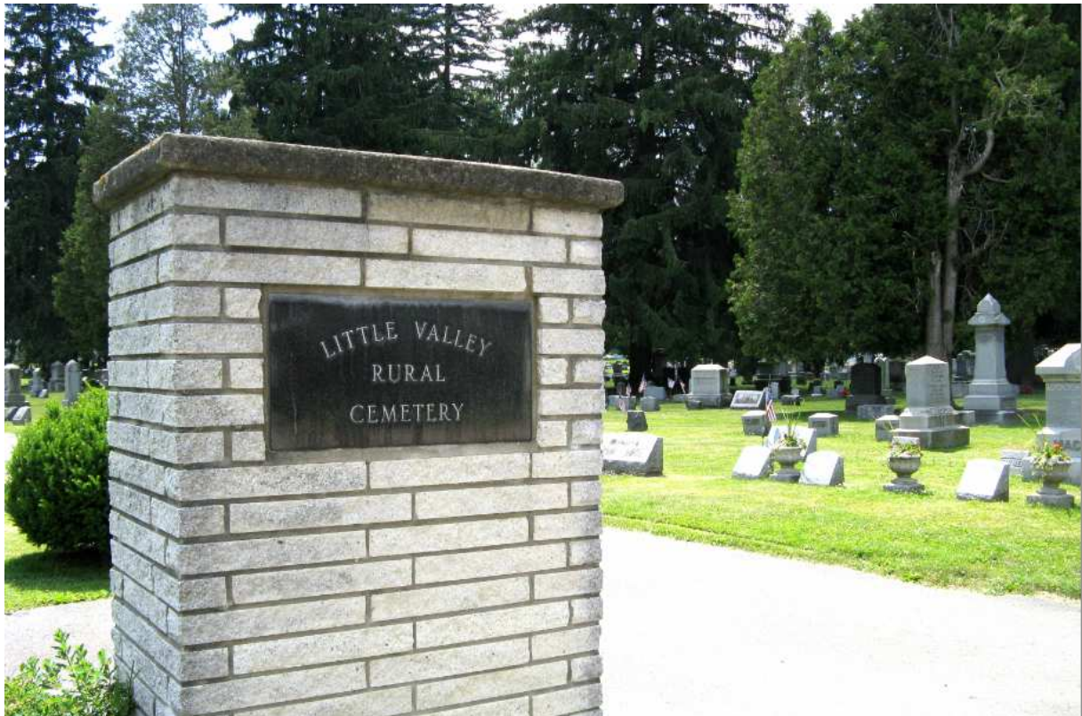
Grabstein auf dem Little Valley Rural Cemetery, Cattaraugus County, New York, USA