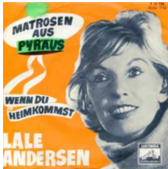
(Single-Cover Lale Anderson)

Es gab aber einige Interpreten, bei denen sich „mein Herz öffnete“: z.B. Everly Brothers, Cliff Richard. Bei den Songs stellte sich immermindestens-ein Akteur mit einer Gitarre in den Vordergrund. Dieses Instrument faszinierte mich sofort.