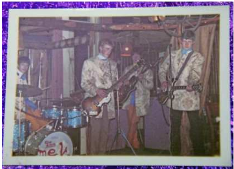
(Meeks im Brauhaus)

So hat sich ein Netzwerk aufgebaut, das über 50 km um Neustadt herum regelmäßige Auftritte ermöglichte. Die Bands haben nicht konkurriert, sondern zusammengearbeitet. Da gab es noch keine „Muckerpolizei“. Wir haben den FBI'S Anlagenteile von uns geliehen; wir haben uns von