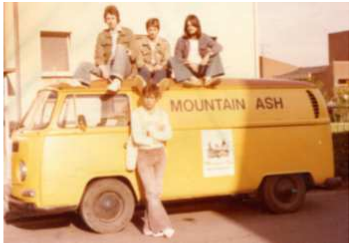
(„Mountain Ash“ 7709)

Mit nur wenigen personellen Veränderungen funktionierte es mit dieser Band für die damaligen Verhältnisse 12 Jahre lang sehr gut. Wir hatten gute Instrumente, eine gute Anlage und ein eigenes Fahrzeug – was damals nicht selbstverständlich war. Sie verschliss in den Jahren den VW-Bus und einen Ford Transit, den wir günstig von der Firma PELIKAN erwerben konnten. Der war so top gepflegt, dass wir ihn 10 Jahre nutzen konnten